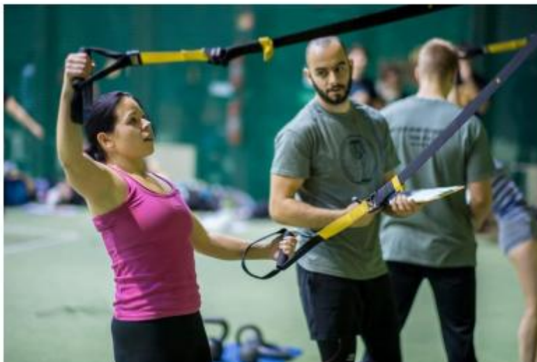
2. ábra Folyamatban lévő TRX gyakorlat