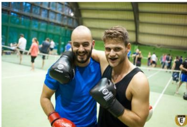
1. ábra edzőtársammal egy thaibox edzés után

heti két alkalommal történtek levezetésre hétfőnként és szerdánként 18:00-20:00 között.