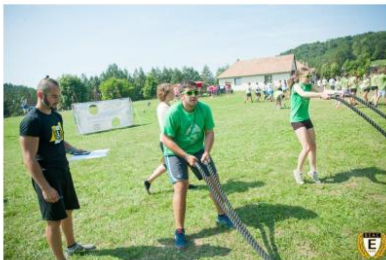
3. ábra Funkcionális köredzés a PPK gólyatáborban (2015)